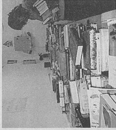
Eskualdeko bigarren eskuko liburuen azoka bat. NAJARA, EXPOSITO

Orto » Goiko Kaleko Festa Batzordeak dei egin die herritarrei liburuak liburutegira eramateko eta azokan parte hartzeko